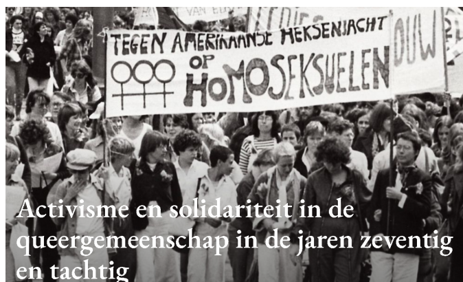
Activisme en solidariteit in de queergemeenschap in de jaren zeventig en tachtig

Deze avond bespreken we de manieren waarop queer belangen werden geagendeerd binnen bredere sociale en politieke bewegingen, zoals feministische en linkse actiegroepen.